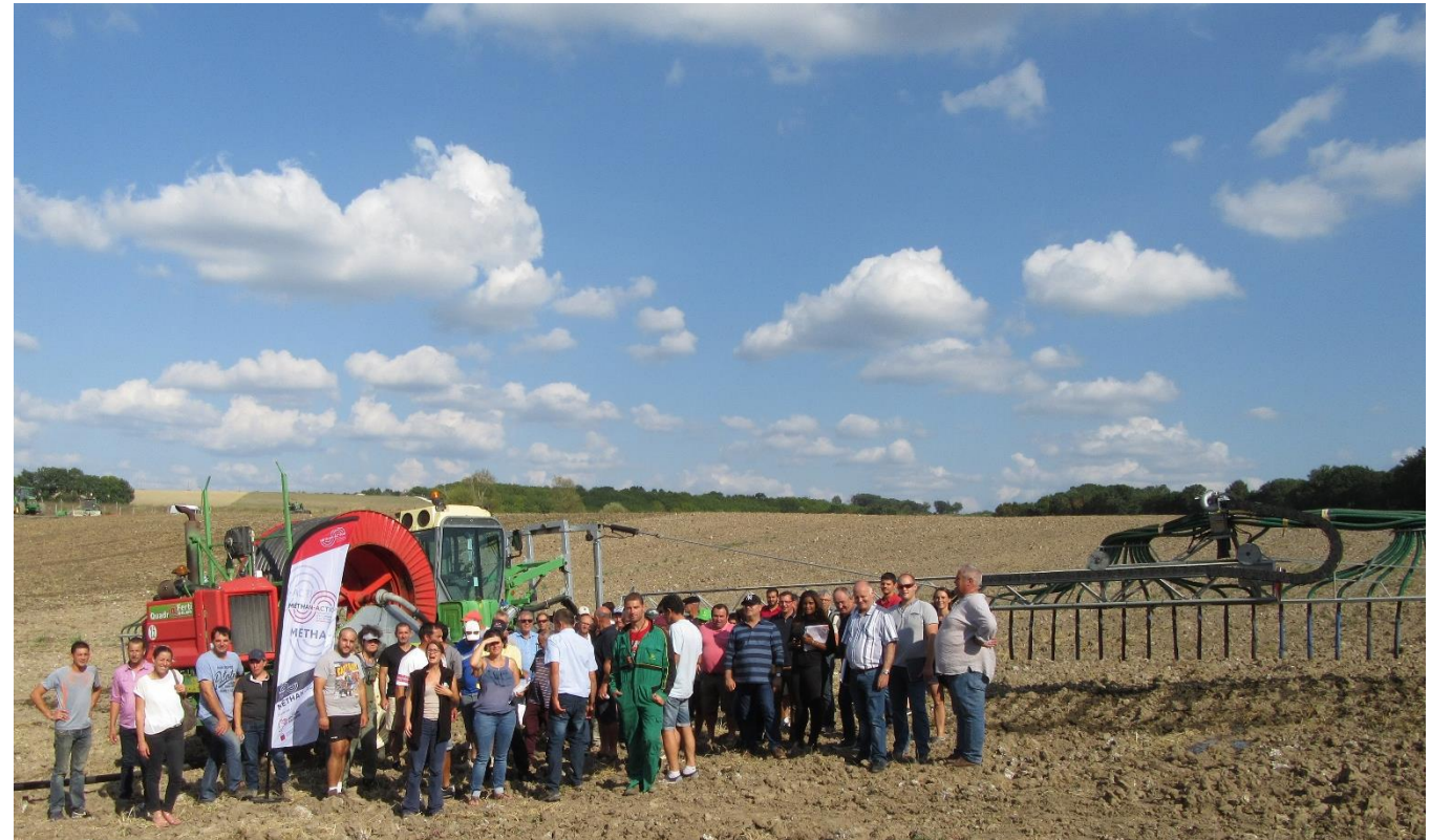
> Rencontre au pied des méthaniseurs (Dordogne, 19 septembre 2018)