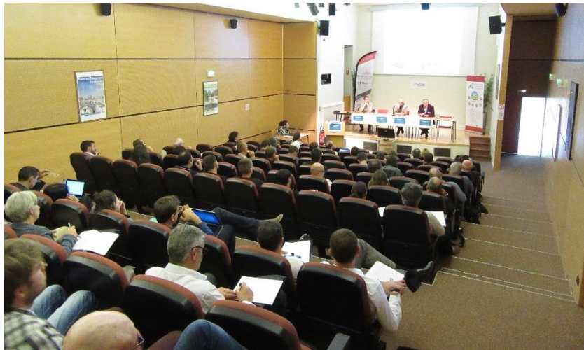
> Rencontre Club des Injecteurs (Saintes, 15 juin 2018)