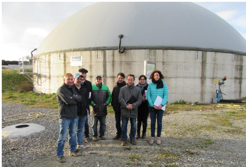
> Formation Maîtriser mon projet (Bretagne, janvier 2018)